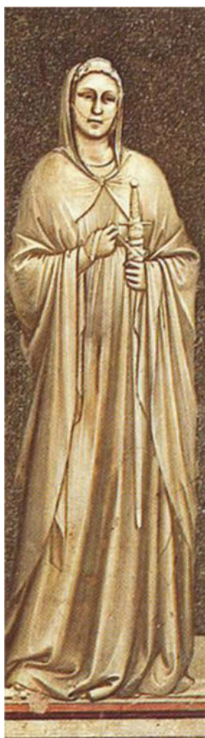
GIOTTO "TEMPERANZA" Cappella degli Scrovegni Padova

U no, due, tre passi indietro: un esercizio mentale che non ci è più consueto. È il senso della misura il vero invitato di pietra al banchetto delle relazioni sociali del nostro tempo.